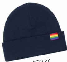
Hue 150 kr.