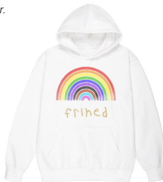
Hoodie til børn 350 kr.