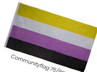
Communityflag 75/99 kr.