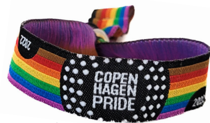
Støttearmbånd 50 kr.