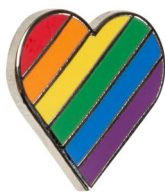
Støttepin 50 kr.